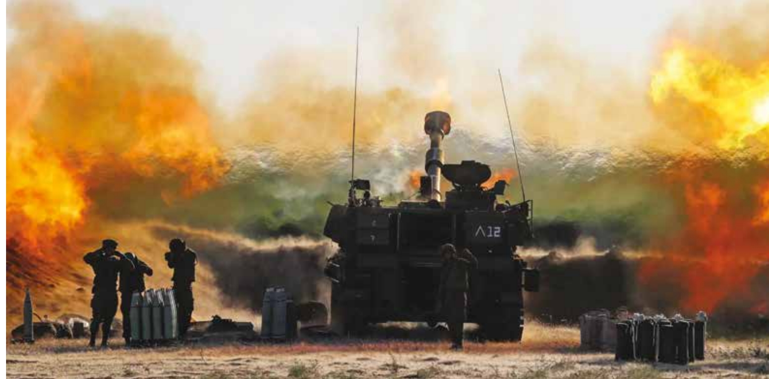
АРТИЛЛЕРИЙСКОЕ ПОДРАЗДЕЛЕНИЕ АРМИИ ИЗРАИЛЯ.

Уничтожение Израиля — официально декларируемая цель ХАМАС. За время его господства в секторе Газа была создана армия боевиков, насчитывающая около 40 тысяч человек, под одноименным городом сооружено так называемое «Газа-метро» — разветвленная система подземных тоннелей и бункеров. Но главное — с помощью Ирана разработано и произведено несколько десятков тысяч ракет. Некоторые из них имеют дальность до 200 км и способны поражать цели практически на всей территории Израиля. В экономическом плане ХАМАС — «содержанка» Ирана, Катара и некоторых других арабских государств. Прибирает она к рукам и большую часть помощи, выделяемой международными организациями и странами Запада для населения сектора и использует эти средства для содержания и вооружения своих боевиков.