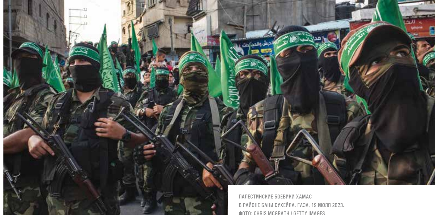
ПАЛЕСТИНСКИЕ БОЕВИКИ ХАМАС В РАЙОНЕ БАНИ СУХЕЙЛА. ГАЗА, 19 ИЮЛЯ 2023.

Мир пытается противостоять религиозному радикализму, который, безусловно, бросает тень на имидж любой религии, будь то ислам, христианство или вуду. Но силы не всегда равны. После очередной агрессивной выходки, теракта, погрома обычные люди начинают опасаться, что все верующие — экстремисты. Этот стереотип может иметь серьезные последствия для религиозных сообществ, вести к их изоляции и к раскручиванию спирали взаимного неприятия.