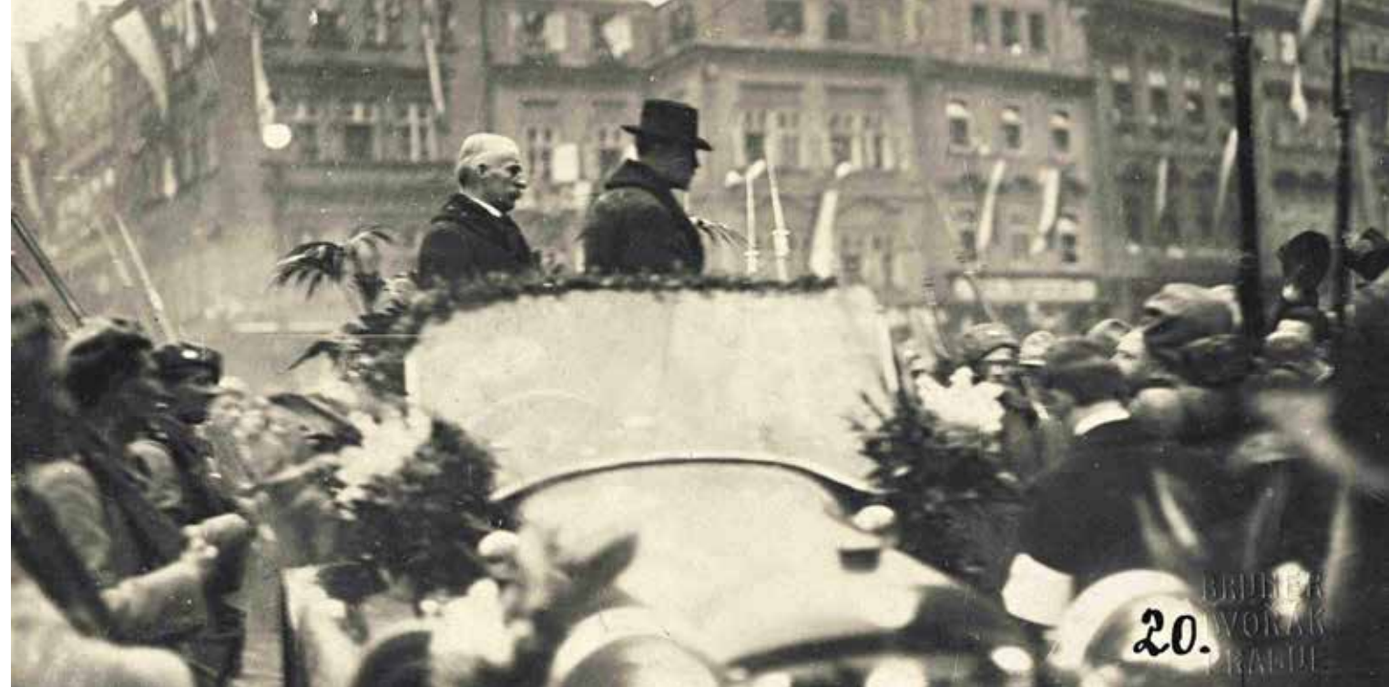
ПРАЖАНЕ ПРИВЕТСТВУЮТ ПЕРВОГО ПРЕЗИДЕНТА ЧЕХОСЛОВАЦКОЙ РЕСПУБЛИКИ ТОМАША ГАРРИКА МАСАРИКА. РЯДОМ С НИМ — ГЕНЕРАЛЬНЫЙ СЕКРЕТАРЬ СОЦИАЛ-ДЕМОКРАТОВ ФРАНТИШЕК ТОМАШЕК. ПРАГА, 21 ДЕКАБРЯ 1918.

В США Масарик читал лекции, публиковал статьи, изо всех сил продвигал свою идею в первую очередь среди живущих в Америке чехов и словаков. В 1918 году Масарик публикует свою знаменитую книгу «Новая Европа: славянская точка зрения» («Nová Evropa: Stanovisko slovanské»), где формулирует идею консолидации молодых центрально- и восточноевропейских государств в послевоенных условиях в виде федерации демократических государств. «Настоящая федерация наций возникнет только тогда, когда нации станут свободными и объединятся. Вот к чему идет развитие Европы <...> Если возникнут федерации малых государств, то это будут свободно основанные федерации, базирующиеся на подлинных нуждах народов, а не на династических и империалистических целях», — писал он.