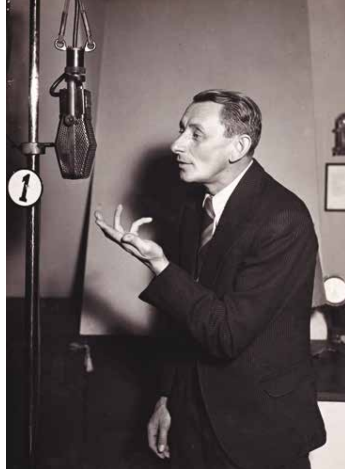
ВЛАСТА БУРИАН У МИКРОФОНА «РАДИОЖУРНАЛА» ВО ВРЕМЯ ЗАПИСИ ДЕТСКОЙ ПЕРЕДАЧИ. ПРАГА, 20 ОКТЯБРЯ 1936. ARCHIVNÍ A PROGRAMOVÉ FONDY ČESKÉHO ROZHLASU

Война догнала Буриана и здесь. В мае 1917 года прямо у входа в Rokoko он был арестован патрулем. Дальше начинается почти швейковская история с симулированием разных болезней, а когда не по-