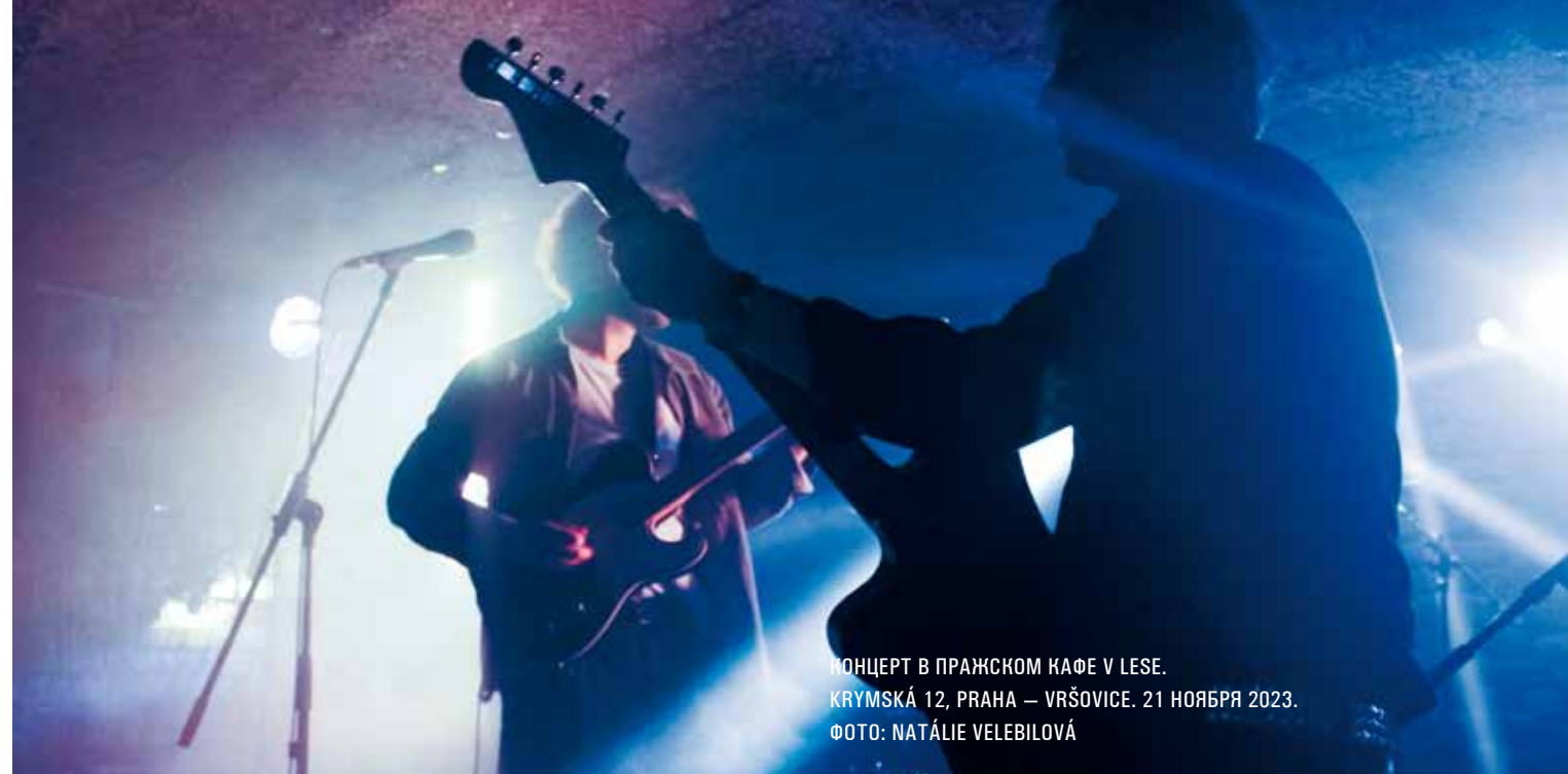
КОНЦЕРТ В ПРАЖСКОМ КАФЕ V LESE. KRYMSKÁ 12, PRAHA — VRŠOVICE. 21 НОЯБРЯ 2023.

После этих слов следует гитарный аккордовый проигрыш, состоящий из трех гитарных power-аккордов. Такой прием — отсылка к классике поп-рока, от Beatles до The Strokes. Но если «классический» рок — музыка жизнеутверждения, протеста, а порой и агрессии, то в XXI веке такой посыл уже невозможен. Дело даже не в том, что рок не смог вывести протест из области культуры в область политики и в результате замкнулся в вакууме субкультуры (вспомним хотя бы слова БГ: «Рок-н-ролл мертв, а я еще нет»). Скорее, проблема в том, что вся современная культура подавляет человека бесконечными подсказками-указаниями: больше покупай, интенсивнее работай, будь социально активен, красив, как люди из инстаграма, счастлив и жизнерадостен. Этот круговорот негласных принуждений, транслируемый через социальные сети, ставит человека в уязвимую позицию, в которой музыка часто выполняет терапевтическую функцию.