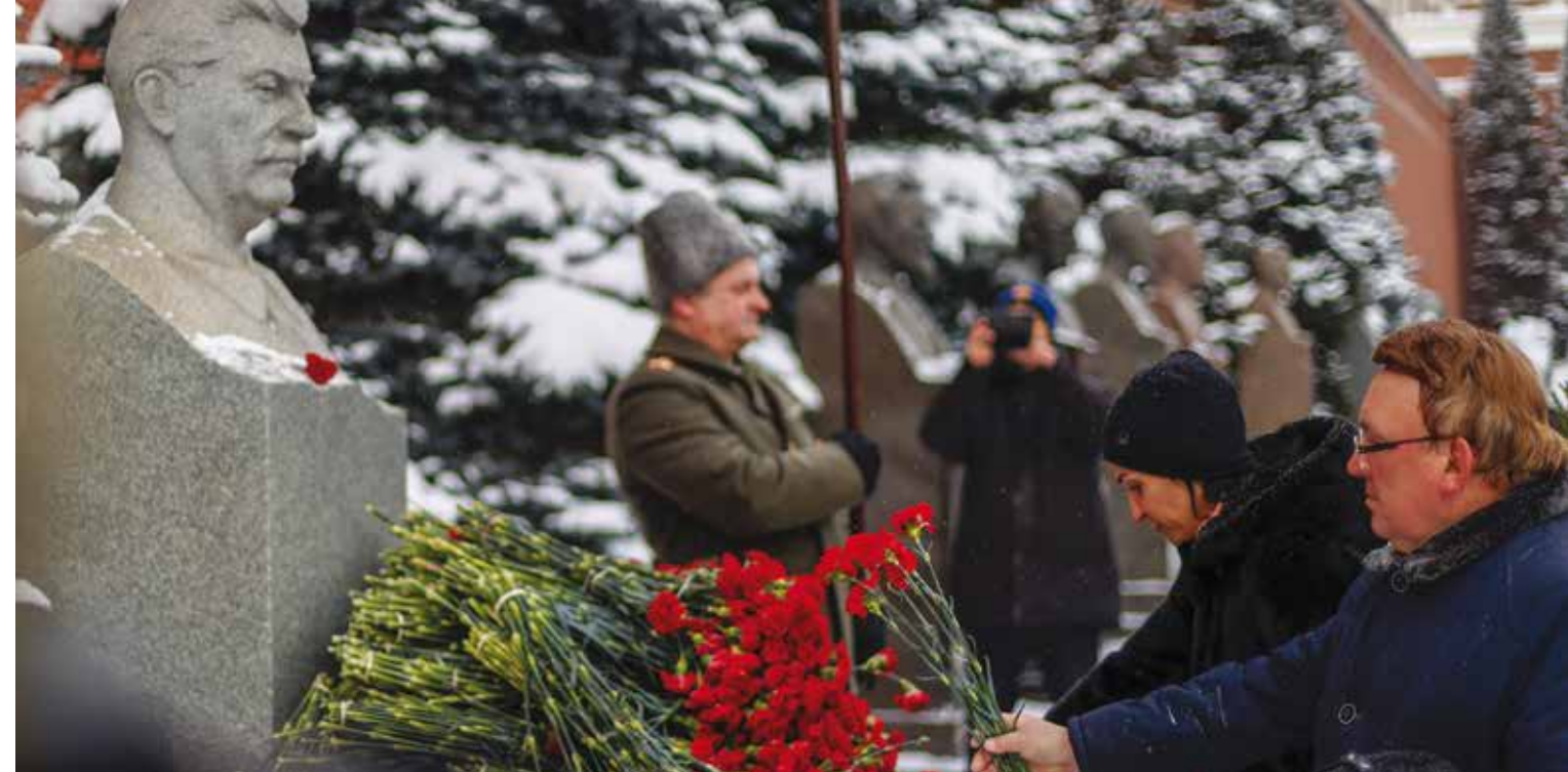
У МОГИЛЫ И. В. СТАЛИНА В 142-Ю ГОДОВЩИНУ ДНЯ ЕГО РОЖДЕНИЯ. МОСКВА, 21 ДЕКАБРЯ 2021.

Но даже если допустить, что победа была добыта ЛДПР по одной из названных причин, ни первая, ни вторая теория не объясняют еще одного принципиально важного обстоятельства. Более половины избирателей проголосовали за партии, которые условно можно назвать силами исторического реванша. К ним относилась не только ЛДПР, но и компартия во главе с Зюгановым, получившая 12 % голосов, ее сельскохозяйственный придаток — Аграрная партия — с 8 % и набравшие столько же неожиданно обретшие политический голос и вес «Женщины России» во главе с многолетней руководителем пионерской организации Алевтиной Федуловой. К ним необходимо добавить маргинальные, но все же прошедшие в Госдуму партии, в руководство которых входили деятели откровенно национал-имперского толка: Константин Затулин, Станислав Говорухин, Сергей Шахрай и некоторые другие. В целом же парламентские выборы 1993 года продемонстрировали широкое распространение реваншистских, проимперских настроений и взглядов в российском обществе. Впоследствии именно