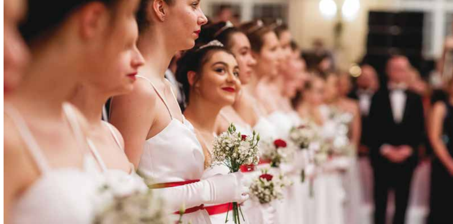
ВЕНСКИЙ БАЛ В ПРАГЕ. 2021.

Осенью и зимой в Чехии проходит множество балов, ставших элементом национальной традиции, и Прага не единственное место, где на них собирается публика. В маленьких городах они порой оказываются менее пафосными, почти домашними, предлагая участникам наря-