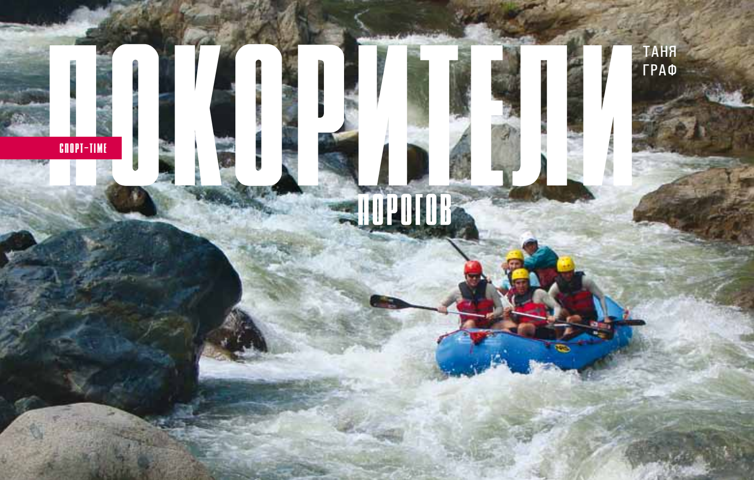
CAMEL WHITE WATER CHALLENGE. ДОМИНИКАНСКАЯ РЕСПУБЛИКА.

К ак часто можно услышать от юного экстремала, что свою порцию адреналина настоящий покоритель водной стихии может получить, только погружаясь в морские пучины как дайвер или оседлав океанские волны на серфе. Между тем на планете немало бурных рек, преодолевая которые на утлых и не очень суденышках, можно и проверить себя на прочность, и испытать не меньший эмоциональный подъем, чем на «большой воде». Такие возможности в избытке предоставляет рафтинг — сплав по реке на специальных надувных лодках. Недаром этот вид активного отдыха и одновременно модный экстремальный вид водного спорта получил широкое распространение по всему миру и заслужил признание любителей острых ощущений.