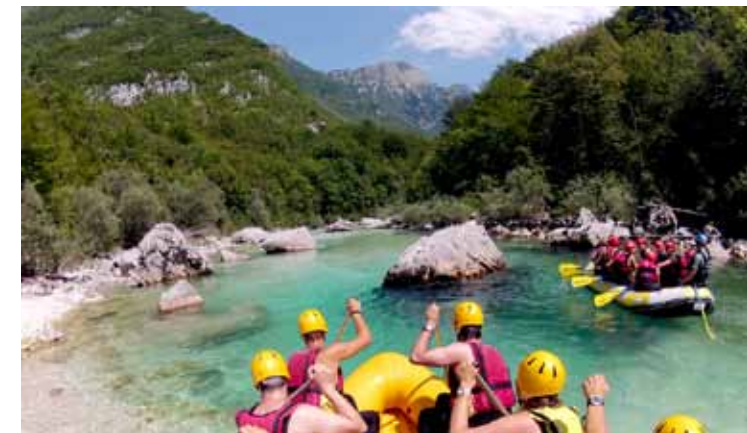
РЕКА СОЧА В СЛОВЕНИИ.

Рафтинг — спорт командный. Гребцы с зафиксированными с помощью специальных петель ногами сидят на гондолах по бортам лодки. Сзади находятся рулевые, один из которых отдает указания и команды, позволяющие гребцам с помощью весел удерживать рафт в заданном направлении. Дело это невероятно сложное: сильное течение кружит лодку как щепку, и только коллективными действиями