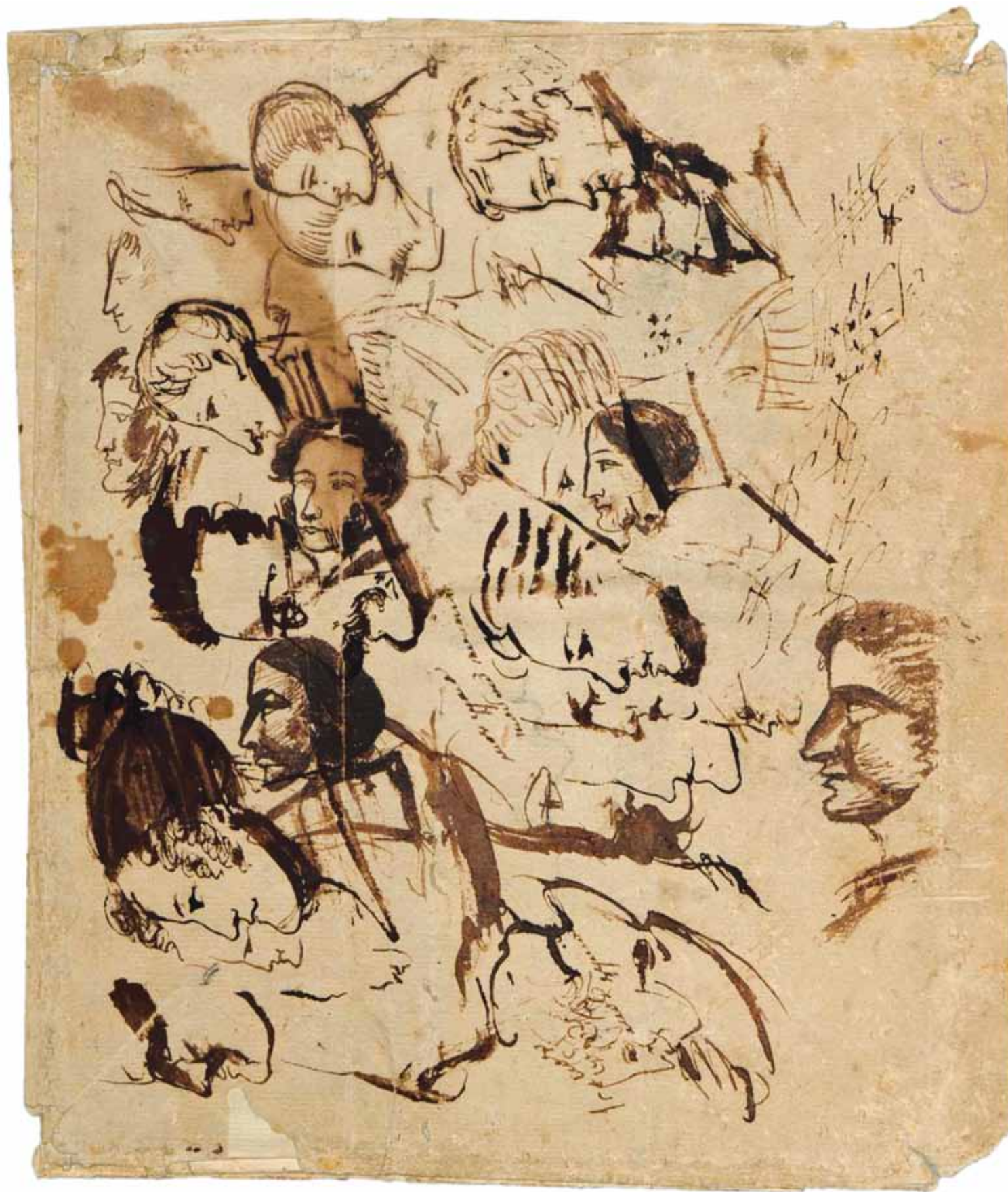
А. С. ПУШКИН. РИСУНКИ НА КОНВЕРТЕ ИЗ ТРИГОРСКОГО. В ЦЕНТРЕ — АВТОПОРТРЕТ. ВТОРАЯ ПОЛОВИНА ИЮЛЯ – АВГУСТ 1826. ПУШКИНСКИЙ ДОМ, СПБ., Ф. 244, ОП. 1, ПД 798, Л. 1