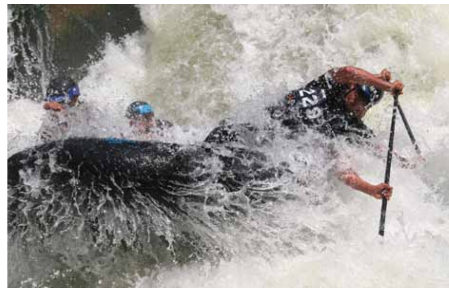
МУЖСКАЯ КОМАНДА США ПО РАФТИНГУ.

Соблюдай правила, уважай командный дух, и тебе покорятся самые сложные пороги!