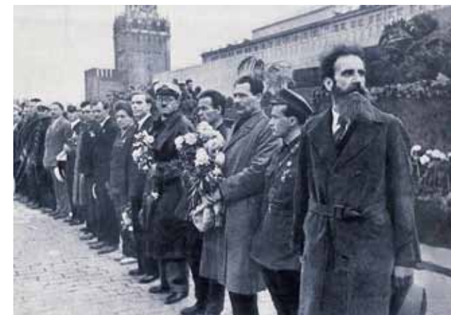
ЧЕСТВОВАНИЕ ЧЕЛЮСКИНЦЕВ НА КРАСНОЙ ПЛОЩАДИ. 19 ИЮНЯ 1934. (СПРАВА НАЛЕВО): О. Ю. ШМИДТ, Н. П. КАМАНИН, В. И. ВОРОНИН, В. С. МОЛОКОВ, А. БОБРОВ, С. А. ЛЕВАНЕВСКИЙ И ДР.

людям, попавших в беду. Была срочно создана правительственная комиссия, в США закуплены самолеты, способные садиться на лед, семь самых опытных советских летчиков и двое американских механиков, обслуживавших «Дугласы», были отправлены на Чукотку, и небывалая спасательная операция началась.