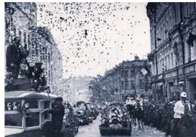
ВСТРЕЧА ЧЕЛЮСКИНЦЕВ НА УЛИЦАХ МОСКВЫ. 1934.

было мало, — а об обычных сухогрузах. Для этой цели в Дании купили корабль, получивший в СССР имя «Челюскин». 2 августа 1933 года судно покинуло Мурманск и взяло курс на Владивосток. По пути предполагалось высадить зимовщиков на остров Врангеля, находящийся между Чукотским и Восточно-Сибирским морями. Возглавил экспедицию сам О. Шмидт. Капитан корабля Владимир Воронин понимал, что к плаванию среди льдов «Челюскин» не приспособлен. Но убедить в этом Шмидта не удалось, а обращаться через его голову к властям повыше Воронин не рискнул.