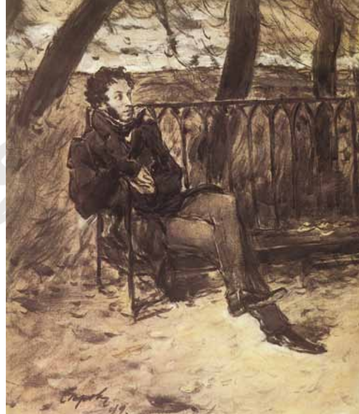
ВАЛЕНТИН СЕРОВ. А. С. ПУШКИН НА САДОВОЙ СКАМЬЕ. 1899. ГУАШЬ, БУМАГА. РАЗМЕР: 33 X 28,4 СМ. МУЗЕЙ ИЗОБРАЗИТЕЛЬНЫХ ИСКУССТВ ИМЕНИ А. С. ПУШКИНА